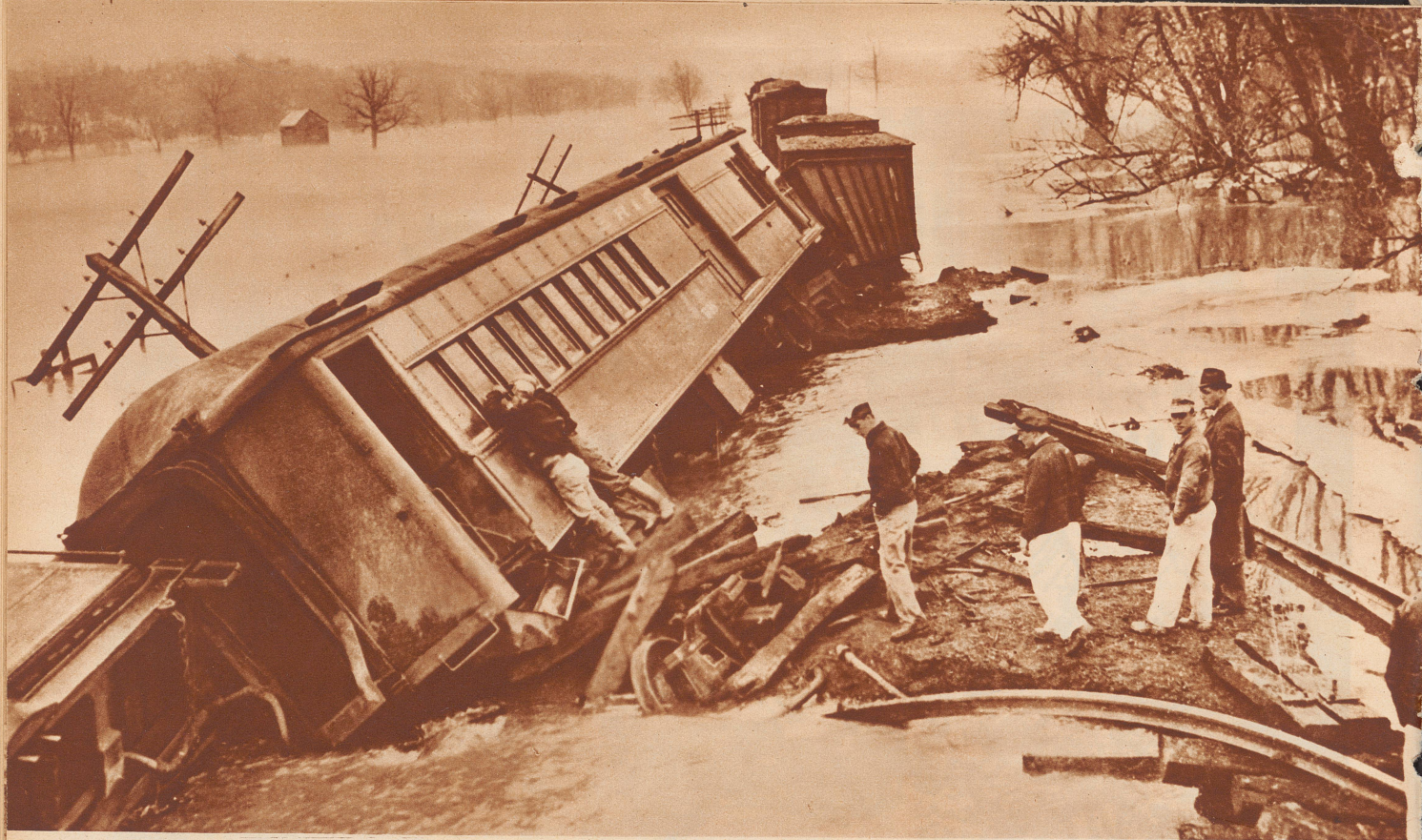
Hochwasser in U. S. A. Schneeschmelze und ausgiebige Regengüsse haben in den nordöstlichen Staaten von U. S. A. riesige Ueberschwemmungen verursacht. Bis jetzt hat die Katastrophe über 400 Menschenleben gefordert und einen materiellen Schaden in der Höhe von mindestens 400 Millionen Dollar angerichtet. Unser Bild zeigt eine überschwemmte Landschaft unweit von Philadelphia im Staate New Jersey. Das Wasser steht an vielen Stellen mehr als 1 Meter hoch. Als Folge des unterspülten Dammes ist dieser Eisenbahnzug entgleist.