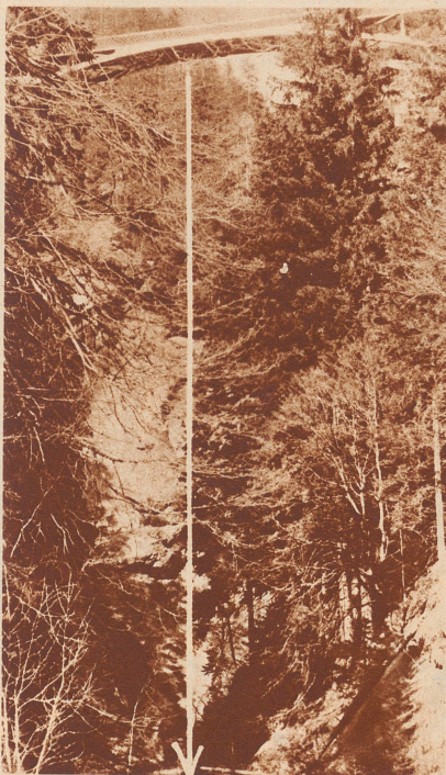
Die Versamer Brücke über die Rabiusaschlucht. Die senkrechte Linie markiert die Höhe der Brücke über dem Rabiusawasser, sie beträgt 70 Meter. Der Wagen stürzte nicht von der Brücke ab, sondern geriet – wie die Räder Spuren zeigten – unmittelbar vor derselben über die Straße hinaus.