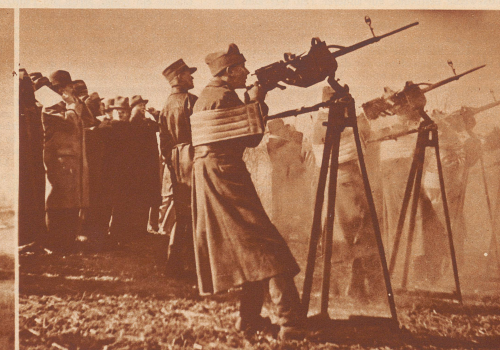
Fliegeroldaten bei der Vorführung von Fliegerabwehr-Maschinengewehren