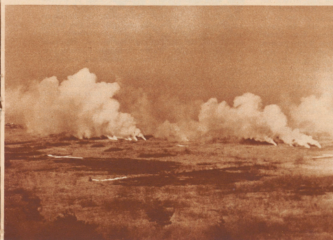
Das Zielgelände nach der Explosion der abgeworfenen Bomben.