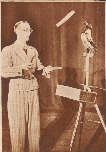
Ein Herr Nova brachte einer Nebelkrähe das Jonglieren mit kleinen Bällen und Keulen bei. Wie er das Kunststück fertig brachte, das erzählt euch hier der Unggle Redakteur.