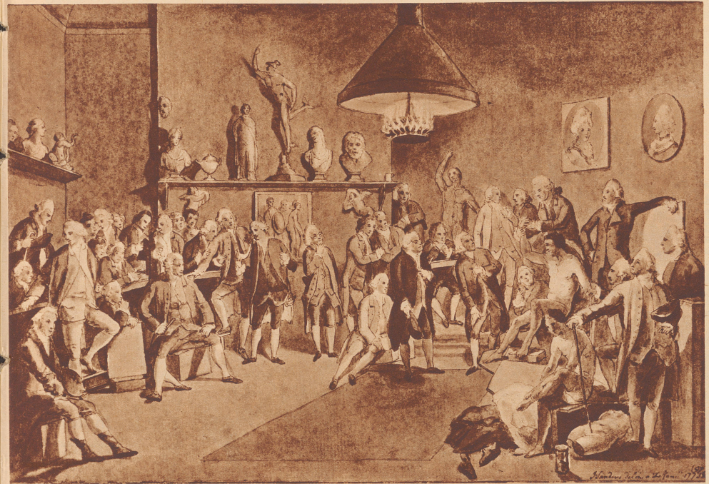
«Das lebende Modell».