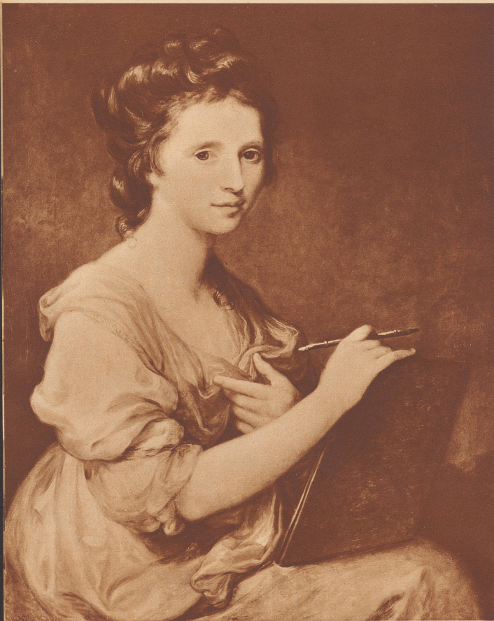
Selbstporträt von Angelica Kauffman.

Es hängt in der «National Portrait Gallery», wo sonst nur Bildnisse der bedeutendsten englischen Persönlichkeiten aufgenommen werden.