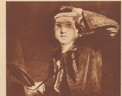
Selbstporträt Sir Joshua Reynolds des damals größten englischen Malers.