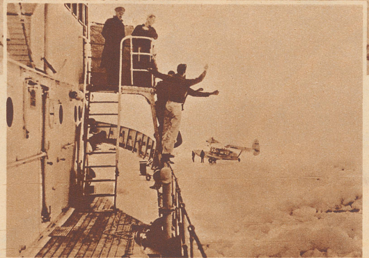
Das Rettungsflugzeug ist auf der Eisscholle gelandet.

In Nordamerika An der Küste von Massachusetts in U.S.A. wurden sieben junge Leute auf einer Eisscholle vom Lande abgetrieben. Sie verbrachten mehrere Tage in großer Kälte und ohne Lebensmittel auf dem Meere und erkrankten schwer. Am sechsten Tage gelang es einem Flugzeug, auf der Eisscholle niederzugehen. Es brachte Medikamente, Nahrung und warme Kleider und rettete zwei von den Gefährdeten. Später gelang es einem Küstenwachtschiff, die übrigen fünf an Bord zu nehmen und an Land zu bringen. Bild: Das Küstenwachtschiff «Harriet Land» bahnt sich mühsam einen Weg durch die Eisschollen, um zu den halbverhungerten jungen Leuten vorzudringen.