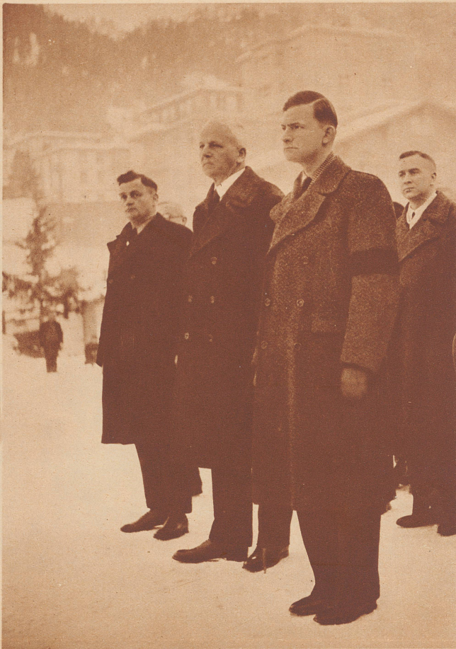
Zwei Prominente bei der Davoser Trauerfeier. In der Mitte: Freiherr von Weizsäcker, der deutsche Gesandte in Bern; rechts: der Leiter der Auslandsorganisationen der N. S. D. A. P. Bohle. Außerdem waren zur Feier fast alle deutschen Konsuln und Vertreter der deutschen Vereinigungen in der Schweiz erschienen.