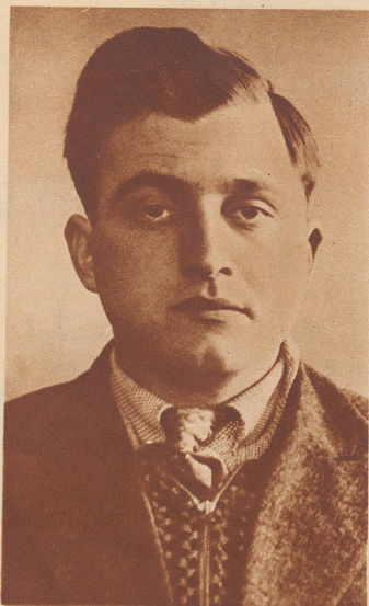
Der Attentäter David Frankfurter 26jährig, jugoslawischer Nationalität, Student der Medizin an der Universität Bern.