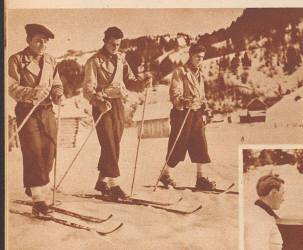
Links: Zum erstmalig auch die Türken am Start.