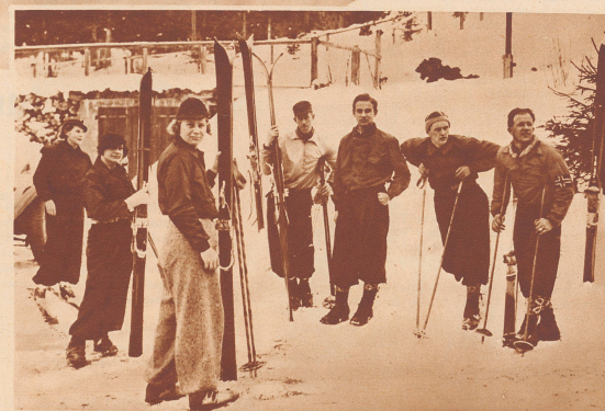
Norwegische Abfahrtsläufer und -läuferinnen.