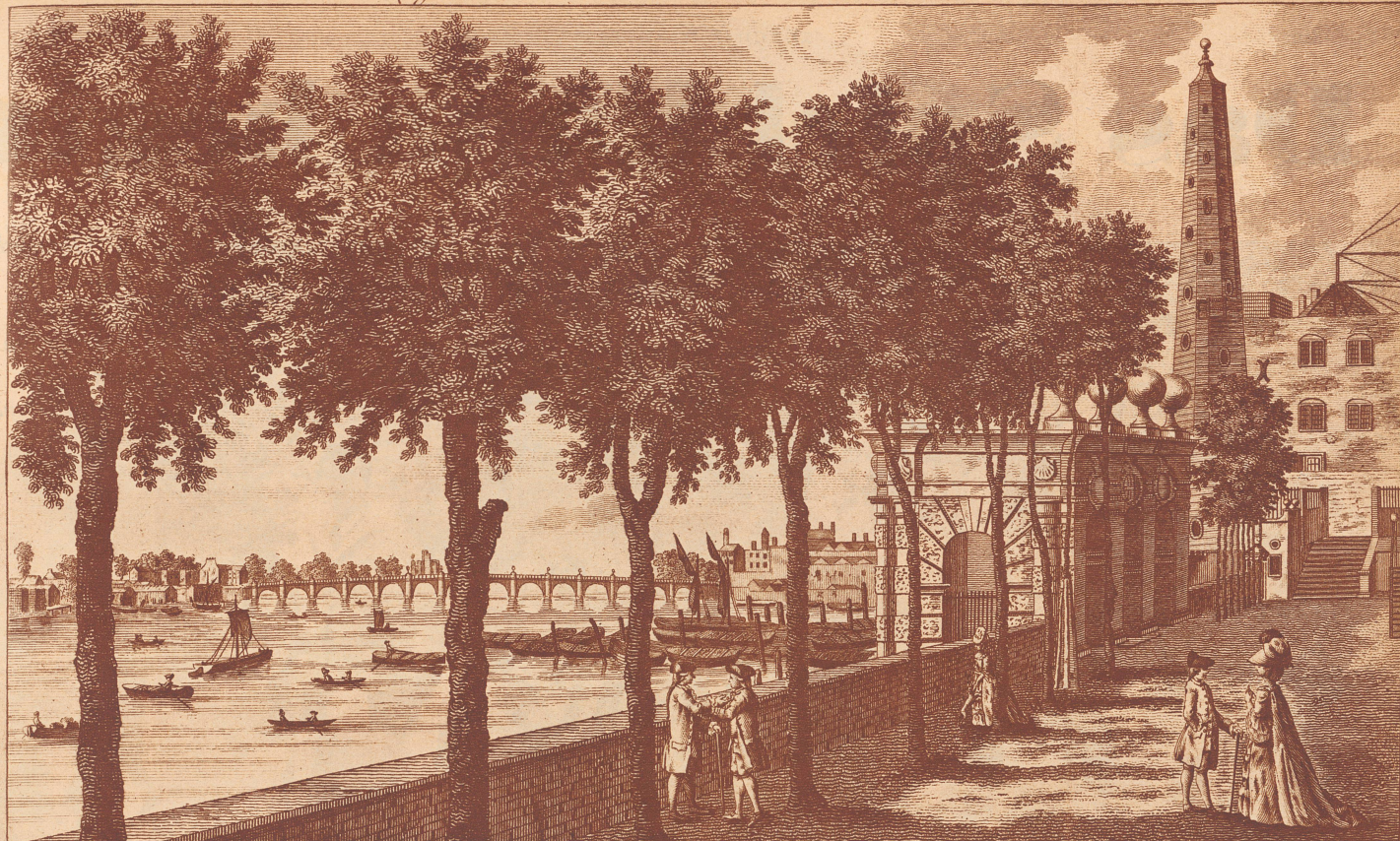
View of the STAIRS at YORK BUILDINGS in the Strand, with the WATER WORKS & a distant prospect of Westminster Bridge, &c.

Alter Stich. Blick auf die von Labele erbaute Westminster-Brücke.