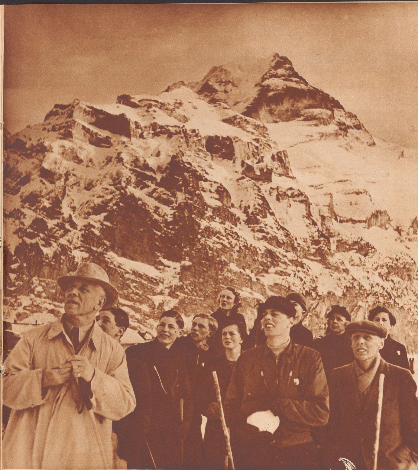
Englische Gäste als Zuschauer bei den Skiwettkämpfen des vorigen Sonntags in Mürren im Berner Oberland. Im Hintergrund die Jungfrau.