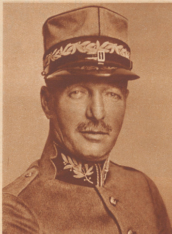
Oberstkörpskommandant Ulrich Wille

ist vom Kommando des 2. Armee-körps zurückgetreten und wurde zum Waffenchef der Infanterie ernannt.