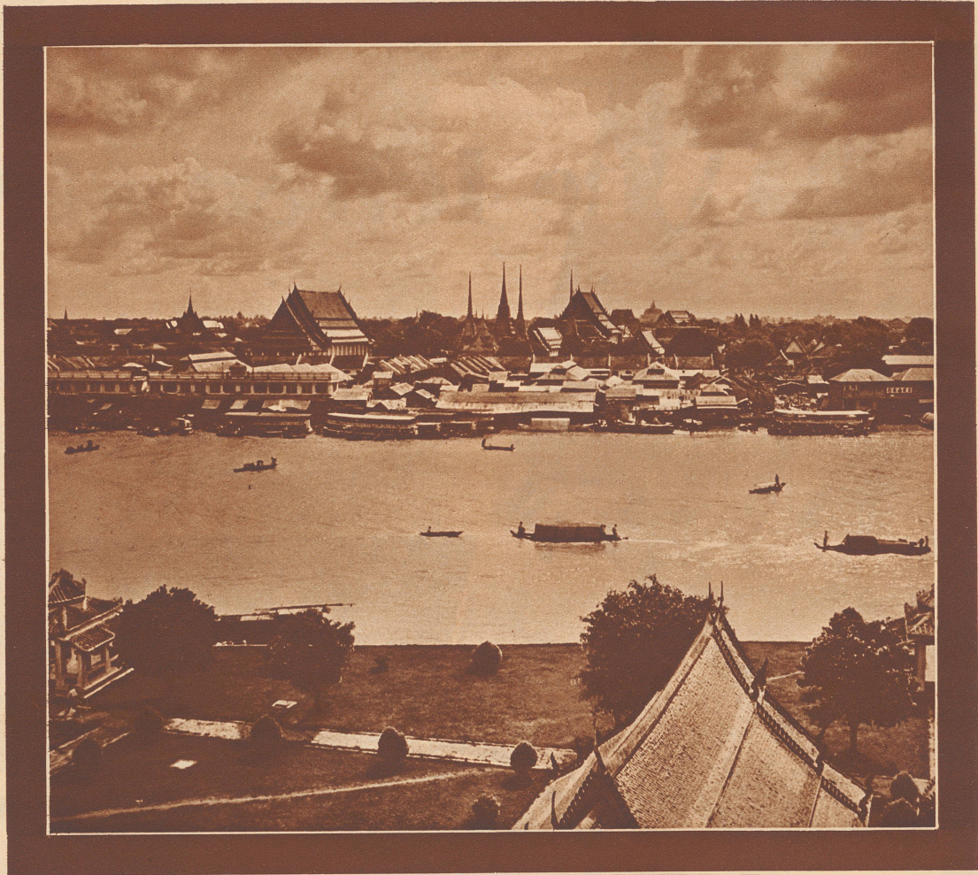
Ausblick vom Turm des Arun-Tempels

Die Tempelstadt Bangkok, Hauptstadt des Königreichs Siam, mit dem Menam (Fluß), vom Turm des Wat Arun aus gesehen, Blick nach Osten. In der Mitte hinten die Spitzen der Pagoden des Wat Po zwischen den gewaltigen Tempelgiebeln des Wat Po und Wat Sudat.