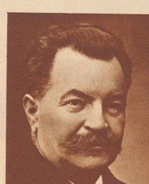
† Nationalrat E. Hardmeier Präsident des zürcherischen kantonalen Lehrervereins, Kantonsrat und seit 1917 Vertreter der Zürcher Demokraten im Nationalrat, starb 65 Jahre alt.