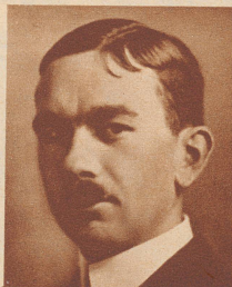
Victor Gautier bisher Präsident der Verwaltungskommission der Schweizerischen Diskontbank, ist vom Bundesrat zum Direktor am Sitze Bern der Schweizerischen Nationalbank gewählt worden.

Eines der schwierigsten Probleme in diesem ostafrikanischen Kolonialkrieg ist die Versorgung der an der Front stehenden Truppen mit Lebensmitteln und Kriegsmaterial. Auf Seite der Italiener vollzieht sich der Nachschub in der Hauptsache mit Hilfe der Lastautomobile, zu deren Verwendbarkeit in den besetzten Gebieten freilich fast überall zuerst die Straßen gebaut werden müssen. Die Abessinier besitzen wenig Automobile; sie benützen im Krieg wie im Frieden das uralte Transportmittel Afrikas, das Dromedar, in geringem Maße auch das Maultier. Die obigen Kamele gehören zu einem Heer bäuerlicher Truppen aus den westlich von Addis Abeba gelegenen Provinzen, das sich auf dem Marsch zur Nordfront befindet. 75 000 Menschen zählt das Heer. Miteingerechnet in dieser Zahl sind die Frauen und Kinder, die die Krieger an die Front begleiten. Als Unterkunftsmittel führt diese Armee 18 000 Zelte mit. Der Photograph, der dieses Bild gemacht hat, bemerkt dazu: «ich war der erste weiße Mensch und meine Kamera der erste Photoapparat den diese Eingeborenen gesehen hatten. Als das Heer von Addis Abeba Richtung Nordfront aufbrach, begleitete der Negus auf einem Maultier die mehr als sieben Meilen lange Karawane ein Stück des Weges»