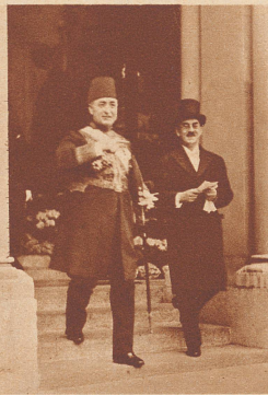
Fakhry Pascha der neuernannte Gesandte von Ägypten in Bern. Fakhry Pascha ist der Schwiegersohn des jetzigen Königs Fuad I. von Ägypten und der erste ägyptische Gesandte in der Schweiz.