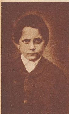
Jugendbild Jakob Schaffners.