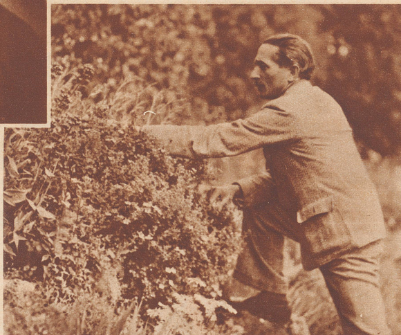
Der Dichter im Jahre 1934.