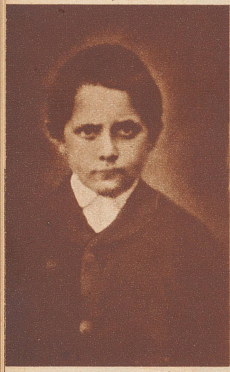
Jugendbild Jakob Schaffners.

Gestern, am 14. November, wurde Jakob Schaffner, der gebürtige Basler, 60-jährig. Seine reiche dichterische Begabung hat sich im frühen Kampf gegen materielle und ideelle Widerstände so sieghaft durchgesetzt, daß er heute zu den «Großen» unter den lebenden Erzählern des deutschen Sprachgebietes gehört. In seinem Roman «Johannes» finden wir des Dichters Entwicklungskurve in einigen bedeutsamen Teilen nachgezeichnet. Wenn die wahren Dichtungen immer zugleich auch Bekenntnisse sind, dann sprechen neben «Johannes» auch die andern Romane und viele Erzählungen Jakob Schaffners überzeugend für das wahre Dichtertum ihres Schöpfers.