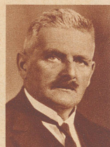
† Jules Mayor

Dozent für Handelsrecht und Steuerwesen an der Universität Basel, ehemaliger Regierungsrat von Baselstadt und während vieler Jahre Vertreter der Liberalen im Nationalrat, den er 1907 präsidierte, starb 89 Jahre alt.