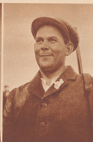
Kärrner (Estland) errang mit 377 Punkten die Weltmeisterschaft im Kniend-Schießen.