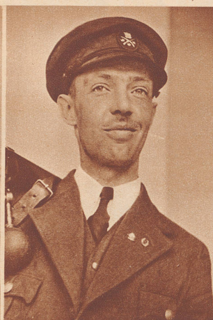
Rönnmark (Schweden) wurde mit 392 Punkten Weltmeister im Liegend-Schießen.