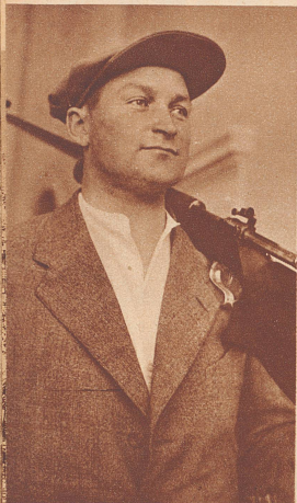
Miinalainen (Finnland) wurde mit 1111 Punkten und 56 Zehnern Weltmeister im Einzelklassement.