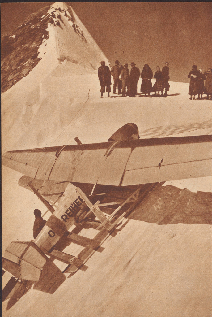
Schwieriger Transport eines Segelflugzeuges von der Station Jungfrauoch über den Firn auf das 50 Meter höher gelegene Plateau.