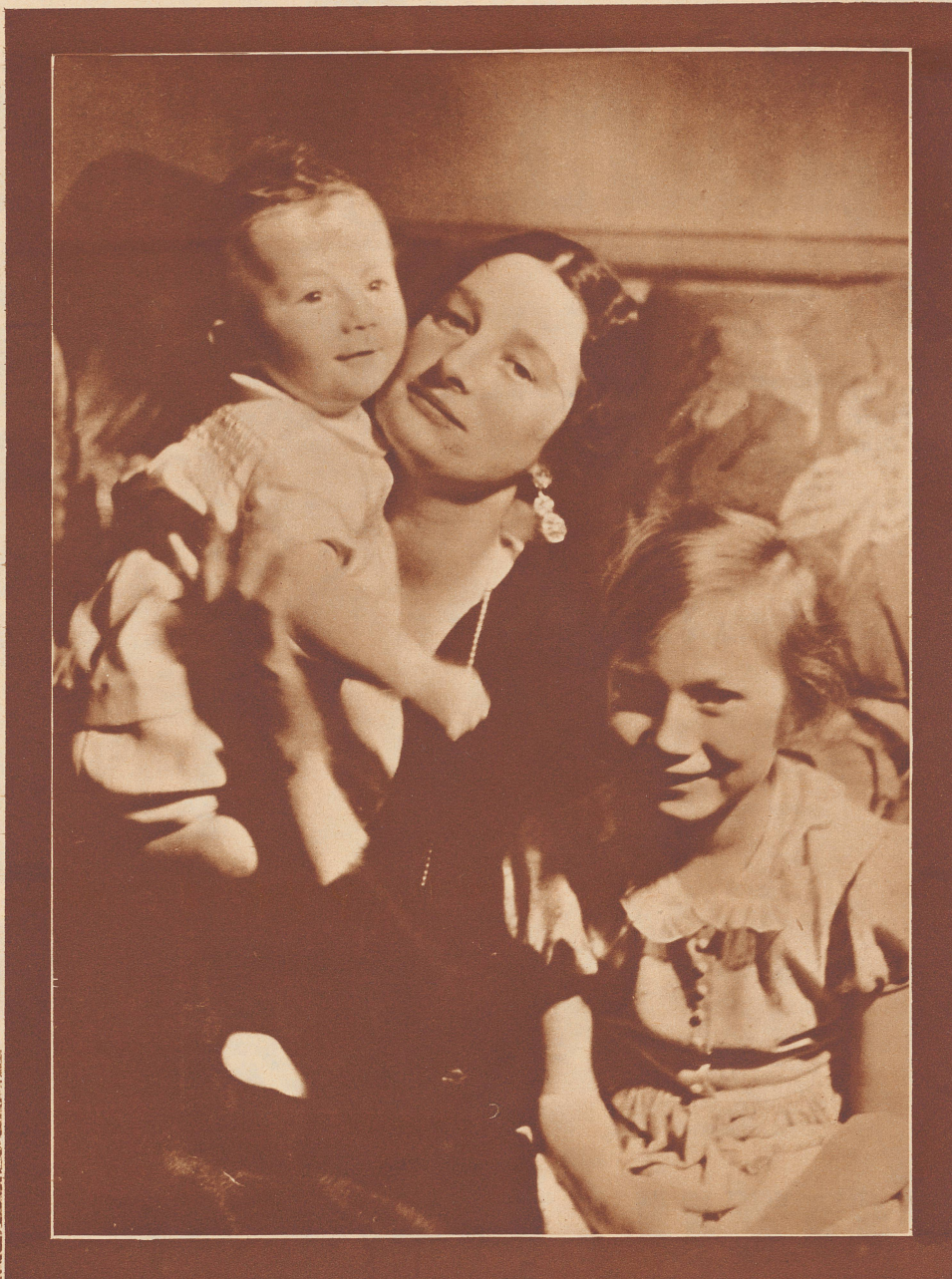
Königin Astrid von Belgien, eine ehemalige schwedische Prinzessin, mit ihren beiden Kindern Prinzessin Josephine-Charlotte und Prinz Albert.

die Unglücksstelle an der Seestraße, etwa 1 Kilometer vor dem Einfahrt von Küßnacht. Der Wagen fuhr über die etwa 1,50 m hohe Mauer hinaus und stieß mit dem Baum zusammen. Durch den Anprall wurde die Königin hinausgeschleudert und fiel auf der Stelle, wo die Behörden von Küßnacht einen Leichnam niedergelegt haben, tot liegen.