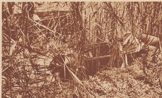
Nach dem Zusammenstoß mit dem Baum fuhr der Wagen – sich anscheinend mehrere Male überschlagend – 70 bis 80 Meter weiter, dabei wurden auch König Leopold und der Chauffeur verletzt. Bild: Das zertrümmerte Automobil im See, der hier etwa einen Meter tief ist.