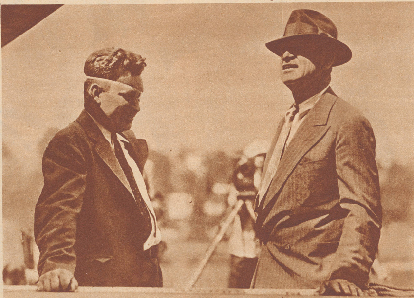
Der einäugige Flieger Wiley Post (links) und sein Freund, der berühmte Schauspieler und Humorist Will Rogers, kurz vor dem Aufstieg.