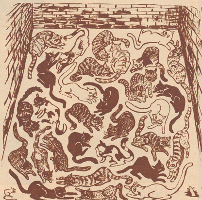
Die Maus sollte den Weg ins Mäuseloch finden, ohne ins Blickfeld einer Katze zu geraten.

Cowboy als humoristischen Erzähler für sein Theater. Will Rogers hatte ungeheuren Erfolg und war bald einer der beliebtesten Humoristen Amerikas. Nicht allein auf den Bühnen trat er auf, sondern man bat ihn auch in die Zeitungen zu schreiben, weil das, was er sagte, nicht nur lustig war, sondern auch einen Sinn hatte. Die Laufbahn dieser beiden Männer ist wirklich phantastisch — ganz amerikanisch kann man sagen. Die Beiden sind eigentlich der beste Beweis dafür, daß man mit festem Willen un-