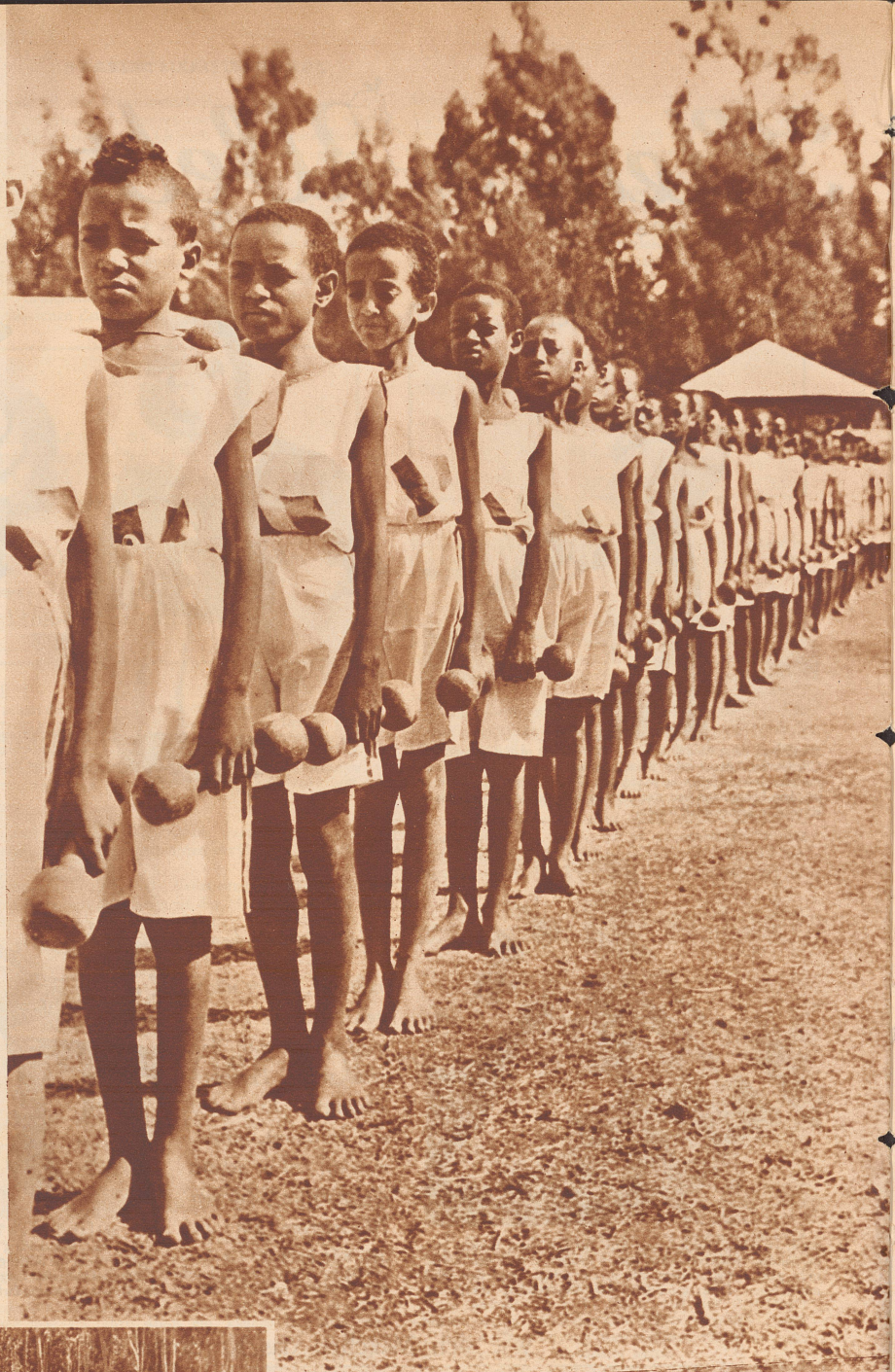
Die jungen Sportler sind zu einer Hantelübung angetreten.

Das sind ein paar Bilder von dem ersten großen Sportfest in Abessinien, das vor kurzer Zeit in Addis Abeba stattfand. Einige hundert Schüler aus den verschiedenen Lehranstalten der Hauptstadt trafen zu einem Meeting zusammen, um ihr sportliches Können zu zeigen. In der Tat waren da ganz respektable Leistungen zu sehen. Sportübungen in jeder Form werden in Abessinien erst seit einem Jahr offiziell gepflegt. Die hervorragenden Leistungen haben einerseits gezeigt, daß die Abessinier eine Sportnation ersten Ranges werden können, andererseits war diese eindrucksvolle Demonstration ein Beweis für den Reformwillen und die modernen Lebensanschauungen des gegenwärtigen Kaisers.