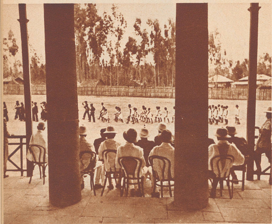
Vorbeimarsch der Sportler an der Ehrentribüne, wo die Gäste Platz genommen haben.

Das sind ein paar Bilder von dem ersten großen Sportfest in Abessinien, das vor kurzer Zeit in Addis Abeba stattfand. Einige hundert Schüler aus den verschiedenen Lehranstalten der Hauptstadt trafen zu einem Meeting zusammen, um ihr sportliches Können zu zeigen. In der Tat waren da ganz respektable Leistungen zu sehen. Sportübungen in jeder Form werden in Abessinien erst seit einem Jahr offiziell gepflegt. Die hervorragenden Leistungen haben einerseits gezeigt, daß die Abessinier eine Sportnation ersten Ranges werden können, andererseits war diese eindrucksvolle Demonstration ein Beweis für den Reformwillen und die modernen Lebensanschauungen des gegenwärtigen Kaisers.