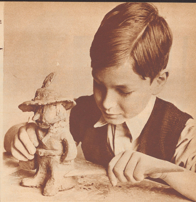
Mit einem Holzspachtel glättet man die Figur.

Ein Marktfräuli aus Lehm. Man kann verschiedenfarbigen Lehm verwenden oder die fertige Figur mit dicker Farbe anmalen.