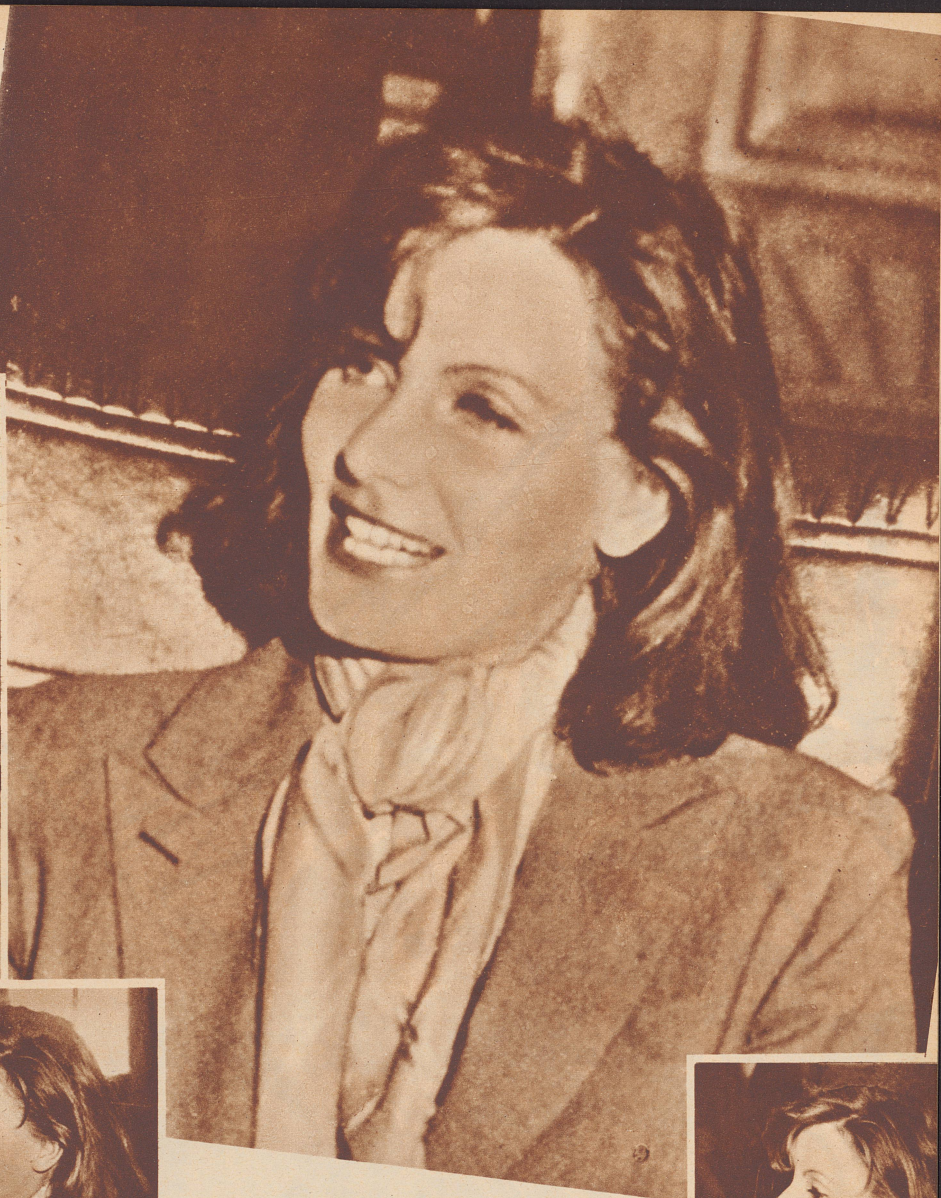
«Welches meine Lieblingsblume, meine Lieblingsfarbe, meine Lieblingspeise sei . . . .!»