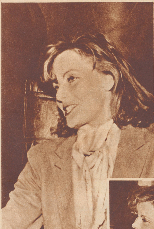
«Natürlich, ich bin hocherfreut, daß Sie mich aufgestöbert haben!»