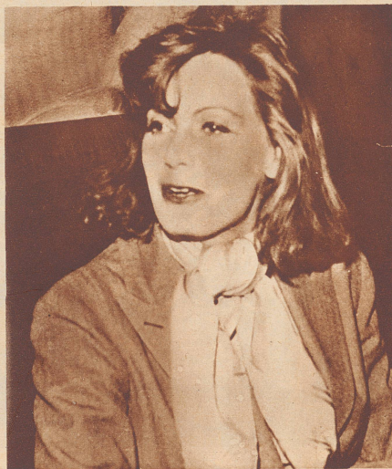
«Ueber meine Lieblingsblume und Lieblingsfarbe gebe ich Ihnen dann in Hollywood Auskunft, jetzt bin ich privat.»