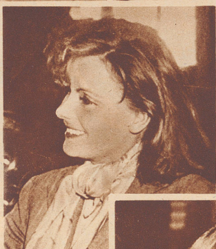
«Doch, doch, ich kann lachen, aber nur wenn ich in Schweden bin.»