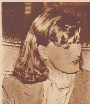
«Wo ich in Schweden wohnen werde? Fragen Sie nicht so indiskret, Sie wissen, ich will meine Ruhe haben.»