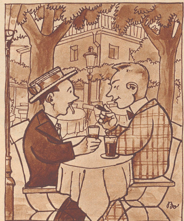
«So, du bisch am Sunntig mit der Louise usgange, das hät allwäg en schöne Huje Gäld koscht!» «Vierehalb Franke!» «Was, nöd meh?» «Sie hät nöd meh bi sich gha!!»

Klient: «Ich habe Ihnen den ganzen Sachverhalt erzählt. Sind Sie unter diesen Umständen der Meinung, daß ich den ganzen Prozeß gewinne?» Rechtsanwalt: «Darauf können Sie mit Bestimmtheit rechnen.» Klient: «Dann lasse ich die Klage lieber. Ich habe Ihnen die Sache meines Gegners erzählt.»