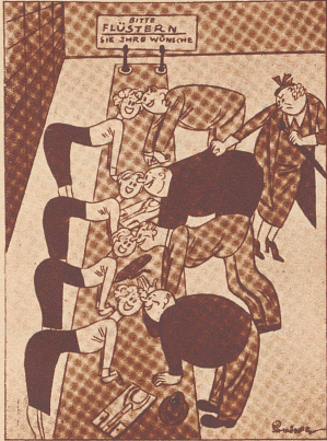
Lärmfreie Woche in Zürich «Ein halbes Dutzend, Kragenweite 42 — — — und was machen Sie heute Abend, pst, pst...»

Sie: «Wenn ich einen Mann nicht leiden kann und er fragt mich, wo ich wohne, dann sage ich immer: draußen in der Vorstadt.» Er: «Ausgezeichnet, Fräulein Ellinson, ausgezeichnet! Aber wo wohnen Sie nun wirklich?» Sie: «Draußen in der Vorstadt, Herr Short.»