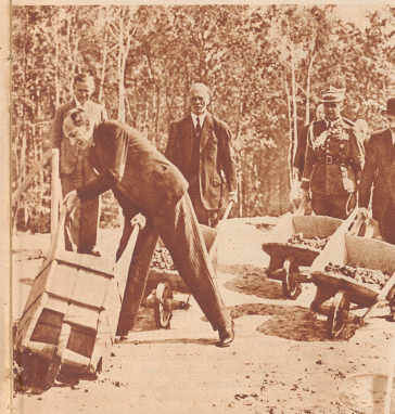
Die Minister mit den Schiebkarren.

Die drei großen Basler Gesangsvereine, Basler Liedertafel, Basler Männerchor und Basler Liedertanz brachten als gesanglichen Auftakt zum Eidgenössischen Sängertage unter Leitung von Hans Münch Händels großes Chorwerk «Alexanderfest» oder «Die Macht der Musik» zu Gehör. Wiederholungen finden am 5. und 8. Juli statt. Bild: Der über 600 Mitwirkende zählende Gesamtchor in der großen Konzerthalle des Mustermeessegebäudes während des Begrüßungskonzertes.