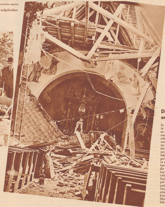
Die Erde bebte am 27. Juni.

Auf dem Gelände des Wawel-Schlusses in Krakau wird für den verstorbenen Marschall Pilsudski ein Ehrengrab errichtet. Unser Bild zeigt die Mitglieder der jetzigen polnischen Regierung, die zu Beginn der Erdbewegungsarbeiten sich an der Errichtung dieses Ehrengrabes persönlich durch Heranschieben eines Schiebkarrens voll Erde beteiligten. Im Vordergrund Außenminister Beck, der erste hinter ihm Switalski, Präsident des polnischen Parlaments, in der Uniform der Generalinspektor der polnischen Armee, General Rydz-Smigly.