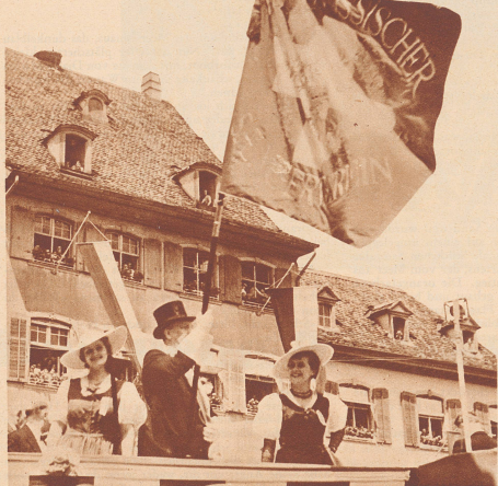
Übergabe der eidgenössischen Sängertage auf dem Münsterplatz in Basel.