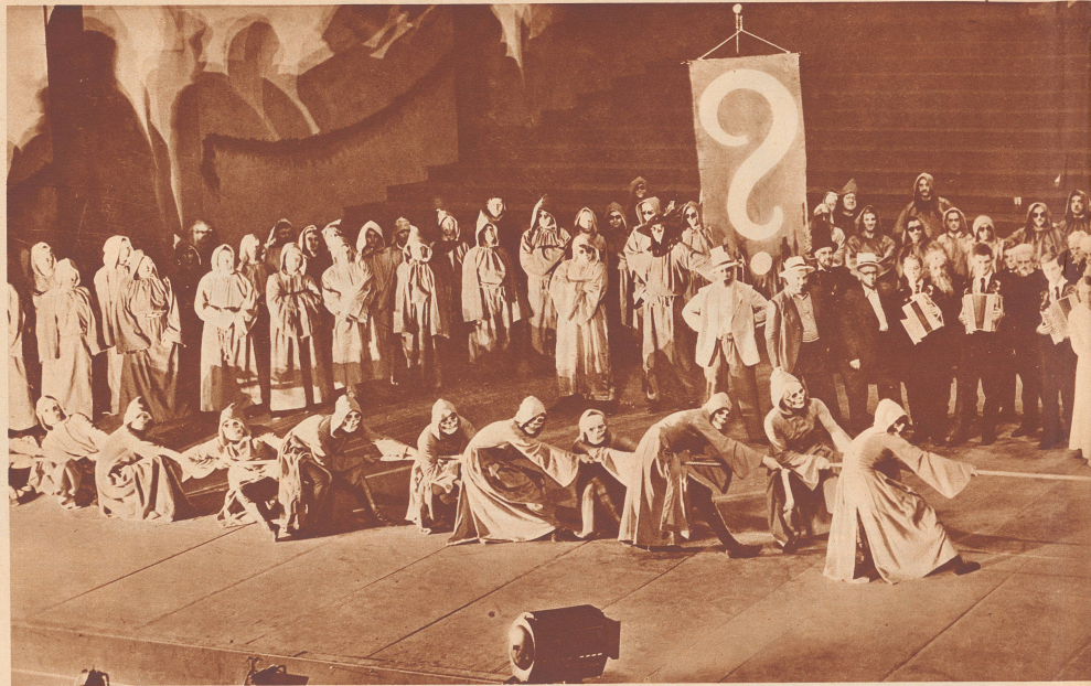
Szene aus dem Festspiel «Mutterland» vom Eidgenössischen Sängertage.

Die düstern Gestalten der Fragezeichen-Gruppe versuchen Freude und Begeisterung der Sänger durch Unglauben und dunkle Prophezeiungen zu dämpfen.