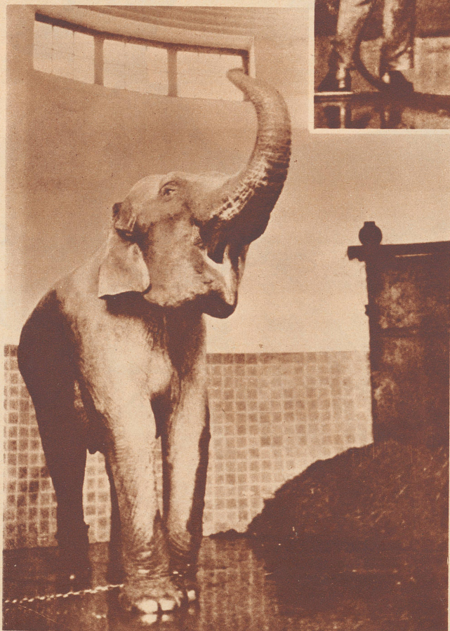
Peppi, der Elefant im Zoo, ist aufgestanden. Er macht es vorerst wie unser Seppli, er gähnt tüchtig.