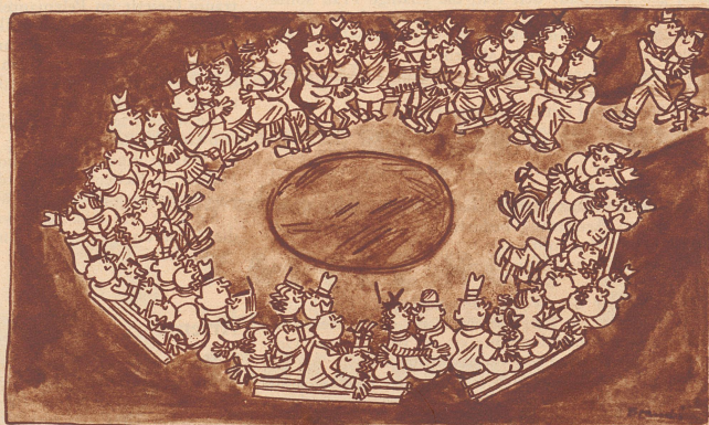
Abends 10 Uhr.