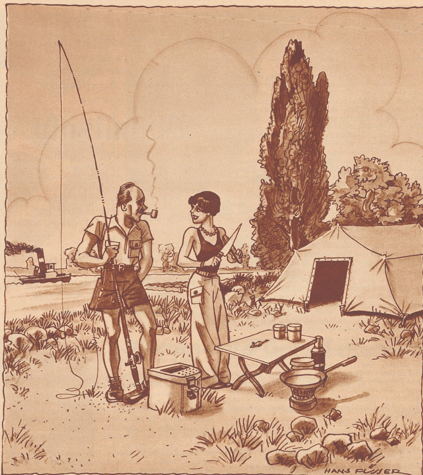
Das selbstgefangene Abendessen.

Der Kurzsichtige: «Was ist das für ein komisches Bild? Museumsdiener: «Das ist ein Spiegel!»