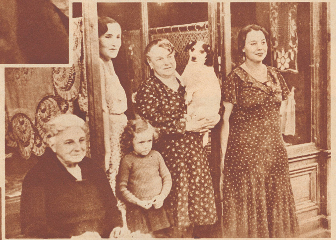
Die Familie vom Laden nebenan schaut dem Straßenphotographen zu, wie er zwei junge Mädchen, die eitel und scheu zugleich sind, abknipst. Kurze Zeit nachher hat man sich entschlossen, auch noch zu einer Aufnahme zu «stehen».

An Festtagen und großen Rummeln ist der Straßenphotograph in südlichen Ländern eine Figur, die so wenig wegzudenken ist wie die Limonadeverkäufer und der Mann, dessen Affen auf einem Seil tanzen. An solchen Tagen, da tragen die Schönen aus dem Volke ihre besten Kleider, die Männer sind frisch rasiert, und wer freute sich nicht darüber,