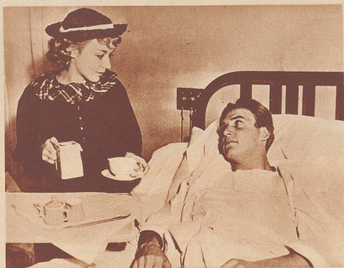
Jackie Coogan, einst als Kind im gleichnamigen Chaplin-Film der Liebling der Welt, hat einen schweren Autounfall gehabt, bei dem sein Vater das Leben verlor, und bei dem er selber verletzt wurde. Die kleine Filmdiva Anne Shirley ist sein häufigster Krankenbesuch.