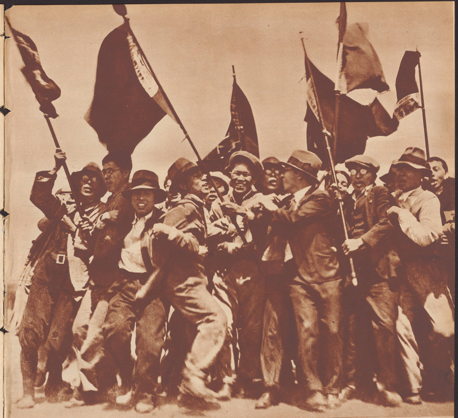
Japanische Arbeiter bei einer politischen Demonstration.