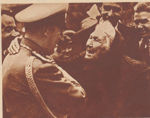
«Ach, so siehst du also aus», sagte die alte bulgarische Frau, als sie den König Boris bei einem Volksaufmarsch auf der Straße zu Gesicht bekam.