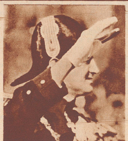
So sieht der Kronprinz Friedrich aus.