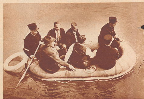
Die Feuerwehr mit dem Gummiboot. Als erste schweizerische Berufsfeuerwehr hat die Basler ständige Feuerwache zur Hilfeleistung bei Unglücksfällen im Schiffsverkehr oder an Badeorten Gummiboote und Taucherausrüstungen angeschafft. Ist die Rettungsmannschaft telefonisch alarmiert, so wird auf der Fahrt zur Unglücksstelle das Gummiboot aufgepumpt. Es vermag 10 Personen zu tragen. Bild: Das Polizeigummiboot bei einer Übungsfahrt auf dem Rhein.

Präsident der Tessiner Landwirtschaftskammer und Mitglied des Zentralvorstandes des Schweizerischen Bauernverbandes, starb 52 Jahre alt in Vacallo.