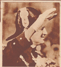
So sieht der Kronprinz Friedrich aus.

Der französische Flieger Delmotte gewann auf Caudron 460, ausgerüstet mit einem Motor von 330 PS, den ersten Preis im diesjährigen Schnelligkeitswettbewerb um den Coupe Deutsch de la Meurthe. Er legte die 2000-Kilometer-Strecke in 4:30,17 Stunden zurück. Sein Stundenmittel betrug 444 km. Bild: Unmittelbar nach dem Rennen wird Delmotte auf dem Flugfeld von Etampes von seiner Frau begrüßt.