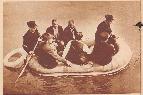
Die Feuerwehr mit dem Gummiboot. Als erste schweizerische Berufsfeuerwehr hat die Basler ständige Feuerwache zur Hilfeleistung bei Unglücksfällen im Schiffsverkehr oder an Badeorten Gummiboote und Taucherausrüstungen angeschafft. Ist die Rettungsmannschaft telephonisch alarmiert, so wird auf der Fahrt zur Unglücksstelle das Gummiboot aufgepumpt. Es vermag 10 Personen zu tragen. Bild: Das Polizeigummiboot bei einer Übungsfahrt auf dem Rhein.

Präsident der Tessiner Landwirtschaftskammer und Mitglied des Zentralvorstandes des Schweizerischen Bauernverbandes, starb 52 Jahre alt in Vacallo.