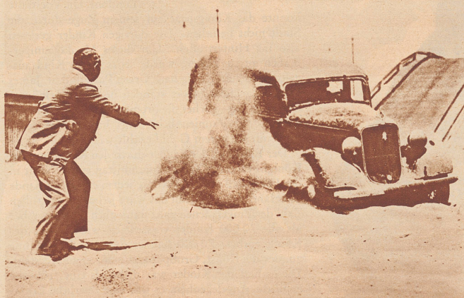
Über einen steilen künstlichen Hügel zu fahren, das ginge noch, aber nachher in scharfen Kurven sandiges Gelände zu durchkreuzen, das ist etwas vom Heikelsten, das dem Auto zugemutet wird.