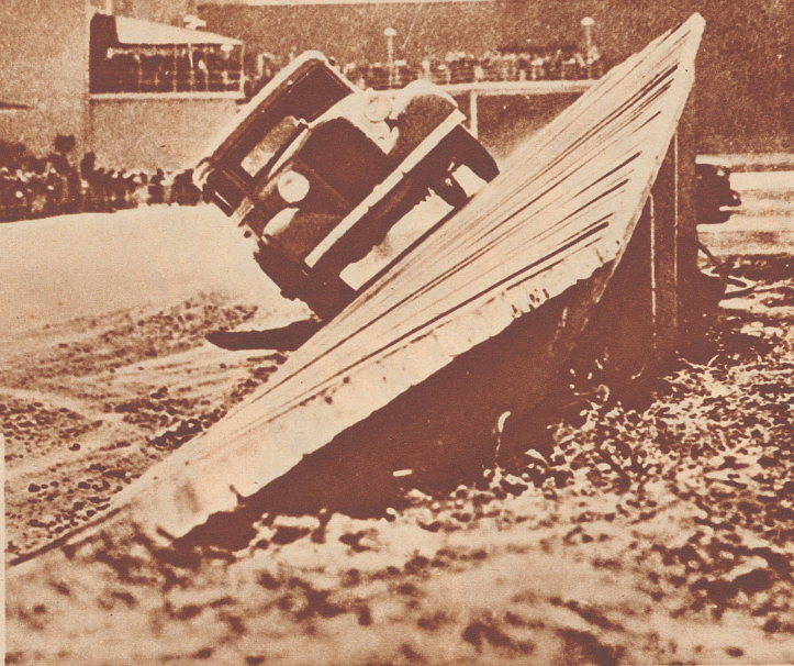
Der Anstieg zur steilen Kurve wird an einer künstlich konstruierten Holzwand vorgeführt.