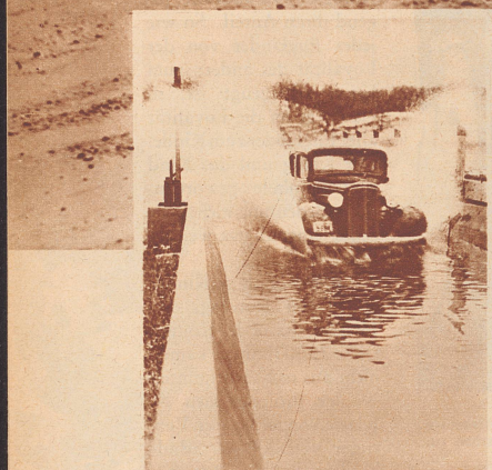
Die Fahrt durch das Flußbett.

Leute, die beabsichtigen, in Amerika ein Auto zu kaufen, tun gut daran, sich bei einem allfälligen Kaufe zu erkundigen, wie das Testresultat ausgefallen ist. Test, das ist die Fähigkeitsprüfung, der sich jeweils ein Musterexemplar einer fabrikneuen Wagenseerie unterziehen muß. Die Prüfung muß dem Charakter des Wagens angepaßt werden. Die fabrikneue Limousine wird auf den Prüfplatz geführt, auf dem alle Tücken und Gefahren, die einem Automobilisten in der Praxis Unannehmlichkeiten bereiten können, rekonstruiert sind. Der Boden dieses Prüfplatzes hat keinerlei Belag, sondern erinnert an eine ungepflasterte, vernachlässigte Landstraße. Abschlüssige Straßenränder, Löcher, kleinere und größere Felsbrocken, ja sogar Flußbette sind die Hindernisse, die der neue Wagen auf seiner Prüfungsfahrt zu bewältigen hat. Auch wird er mit großer Schnelligkeit über die Straße gejagt, um die Kurven geschleudert. Wenn er dann heil aus allen Strapazen dieser Fahrt hervorgeht, dann hat der Probewagen sein Examen bestanden und die ganze Limousinenserie wird zum Verkaufe freigegeben.