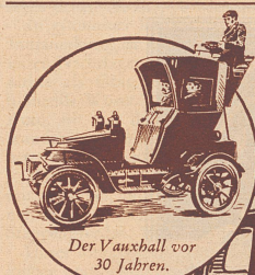
Der Vauxhall vor 30 Jahren.

Aus klugen Küken werden nicht immer kluge Hennen.