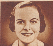
wie die Männer behaupten!

Wo immer sie ging, wurde sie bewundert ihrer schönen, natürlichen Lippen wegen. — Absolut ungeschminktes Aussehen! Natürlich — mit TANGEE. Denn es ist keine Schminke. TANGEE verwandelt seine Farbe auf Ihren Lippen zu einer zarten Rosen-Nuance, der einzig richtigen Farbe für Ihren Teint. Seine Grundcreme erhält die Lippen weich und geschmeidig. Ebenfalls TANGEE Theatricals dunklere Nuance. TANGEE-Gesichtspuder enthält ebenfalls den wunderbaren, farbenverändernden Bestandteil.