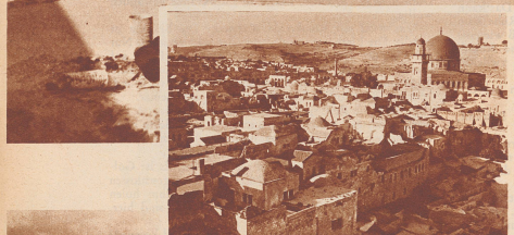
Blick auf Alt-Jerusalem. All die alten, ehrwürdigen Stätten von religiöser und geschichtlicher Bedeutung bleiben unberührt erhalten.