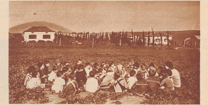
Lektion im Freien der Kleinkinderschule von Tel Adashim.