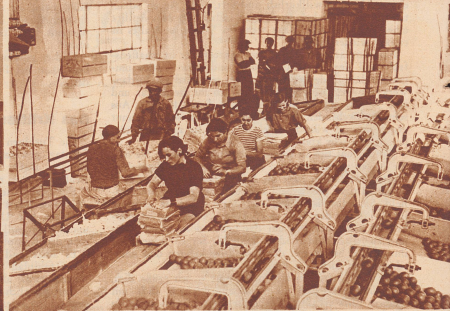
Moderner Packraum eines Orangen-Exporthauses in der jüdischen Kolonie Rehoboth. Seit 1932 hat der Orangen-Export aus Palästina sich verdoppelt. Er bezieht sich heute auf sechs Millionen Kisten pro Jahr. Hauptabnehmer sind England und die nordischen Staaten.