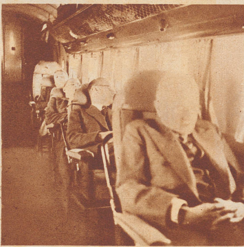
Blick in den 14plätzigen Passagierraum des Douglas-Schnellflugzeuges.