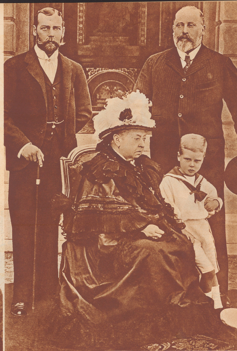
Vier Generationen einer Dynastie. Sitzend: Königin Viktoria von England, rechts oben ihr Sohn Edward VII., links dessen Sohn, der jetzige König George V., dessen 25jähriges Regierungsjubiläum in diesem Sommer gefeiert wird, rechts unten der Prinz of Wales im dritten Altersjahr. Das Bild stammt aus dem Jahre 1897. Königin Viktoria war eine Herrscherin von ganz großem Format. Sie wurde 1819 geboren, bestieg den Thron 1837 und regierte bis 1901, volle 64 Jahre lang. Von ihren neun Kindern heiratete die älteste Tochter den deutschen Kaiser Friedrich, den Vater Wilhelms II. Nach ihrem Tode (1901) bestieg ihr Sohn Edward VII. den Thron von England. 1841 geboren, war er bei seiner Thronbesteigung schon 60 Jahre alt. Er regierte nur neun Jahre. Seit 1863 war er mit Prinzessin Alexandra von Dänemark verheiratet. Der Ehe entsprossen fünf Kinder. Der älteste Sohn Clarence starb früh, der zweite wurde als George V. sein Nachfolger auf dem Thron, die jüngste Tochter Maud heiratete den jetzigen König Haakon VII. von Dänemark. George V. bestieg den Thron von England am 6. Mai 1910. Im Herbst desselben Jahres wurde er in Delhi zum Kaiser von Indien gekrönt. Seither steht er als Herrscher, der faktisch weit weniger Macht besitzt als der Präsident der Republik Frankreich oder der Präsident von U. S. A., wie ein Symbol für die Zusammengehörigkeit des riesigen britischen Weltreiches an der Spitze der Monarchie.