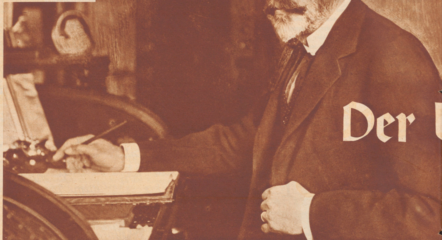
George V., König von England und Kaiser von Indien. Er ist geboren am 3. Juni 1865 in Marlborough-House, als zweiter Sohn Edwards VII. und der Königin Alexandra. Als Nachfolger seines Vaters bestieg er am 6. Mai 1910 den Thron von Großbritannien.