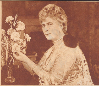
Königin Mary von England, geborene Fürstin von Teck. Sie ist 67 Jahre alt und seit 1893 vermählt mit George V.