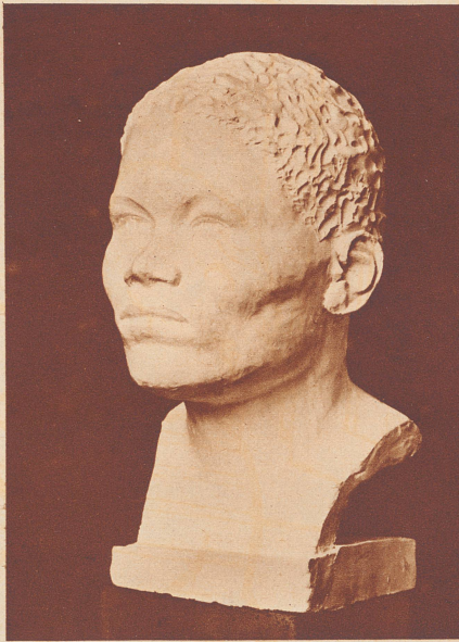
Aufnahme Anthropol. Inst. Wien Rekonstruierter Kopf der Frau von Egozwil, ausgeführt von Rosa Koller, Wien