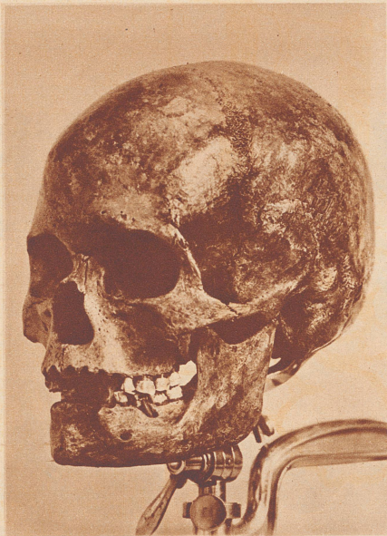
Aufnahme Prof. Schlaginhausen Schädel der Frau von Egozwil.