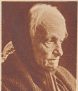
† Johanna Garbald die unter dem Namen Silvia Andrea bekannte Bündner Schriftstellerin, starb 95 Jahre alt in Casta- segna.