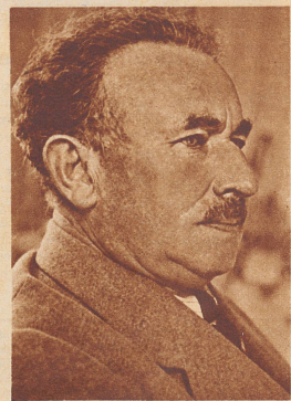
Paul Ilg der bekannte Schwei- zer Schriftsteller, be- ging am 14. März seinen 60. Geburtstag.