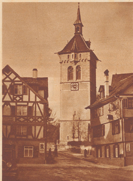
Die katholische Kirche in Arbon. Kennzeichnend für die thurgauische Landschaft ist das Riegelhaus links.

Es sind jetzt etwa siebzehn Jahre her, daß ich mit zwei Freunden über die Grimsel, unterer und oberer Aaregletscher, das Finsteraarhorn und die Jungfrau gemacht habe. Kaum waren wir damals auf dem Rückweg über die Berglöhne auf dem Eismeer angelangt, ging unser Weg an einigen, vier bis fünf Meter hohen Seraks (Eissäulen) vorbei. Der Anblick dieser Eisgebilde war so überwältigend für mich, daß ich halt machte, um sie näher zu betrachten. Meine Gefährten waren weitergegangen und riefen mir nun zu, endlich zu kommen, denn die Säulen könnten jeden Moment zusammenbrechen. Sie riefen mir umsonst, denn ich konnte mich von diesem Naturschauspiel nicht so rasch trennen. Also warteten die Freunde auf mich, und das war unser Glück. In dem Moment, in dem wir aufbrechen wollten, hörten wir über uns ein furchtbares Donnern und Krachen, und kaum hundert Meter weit,