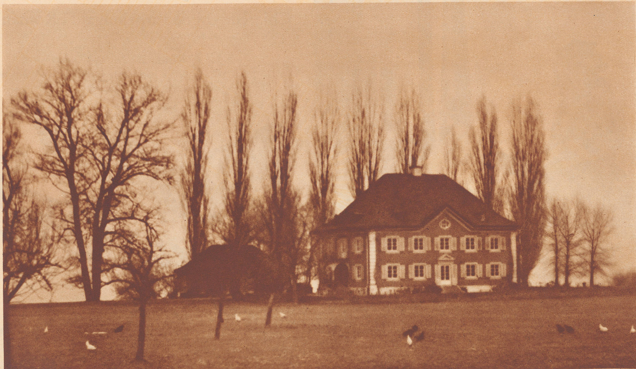
Einer der schönen Landsitze, die am Bodensee so zahlreich sind. Typisch für die Bodenseelandschaft sind die Pappeln. Das Haus liegt ganz am See und befindet sich in der Gegend zwischen Horn und Rorschach.

Erscheinen zwanglos in der «Zürcher Illustrierten» • Alle für die Redaktion bestimmten Sendungen sind zu richten an die «Geschäftsstelle des Wanderbunds», Zürich 4, am Hallwylplatz