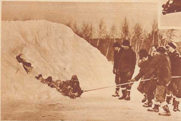
Die heitere Seite: Als Strafe für eine verlorene Schneeballschlacht werden Verlierer von den Siegern an langen Seilen durch einen Schneeburg hindurchgezogen.

In einer arg durch die Wassernot bedrängten Stadt am Mississippi genügten die Feuerwehr, die Polizei und die aufgebotenen Truppen zum Kampf gegen die Wassermassen nicht mehr. Selbst Sträflinge aus den Gefängnissen wurden zur Hilfeleistung herangezogen. Wir sehen sie hier in ihren gestreiften Anzügen beim Anlegen von Schutzdämmen.