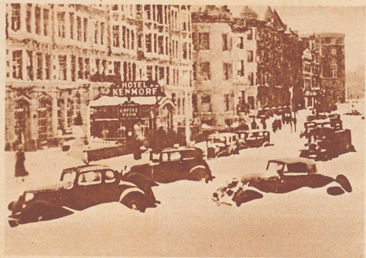
Die Städte der Oststaaten von Washington über New York, Boston und bis Chicago haben gewaltige Schneestürme erfahren. Ueber hundert Menschen sind umgekommen. In den Straßen wurden die Autos zu Dutzenden eingeschneit und blockiert.