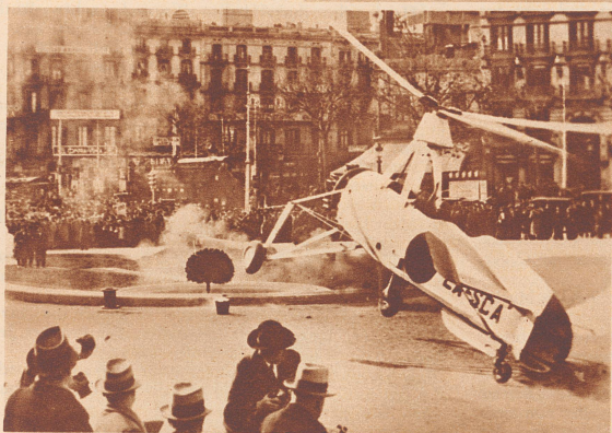
Mißglückter Start. Dieses Cierva-Windmühlenflugzeug sollte anlässlich einer Flugveranstaltung in Barcelona auf einem öffentlichen Platz zu einem Fluge aufsteigen. Der Start mißlang aber, der Autogiro vermochte sich nicht zu erheben, wurde leicht beschädigt und die paar tausend Zuschauer kamen nicht auf ihre Rechnung.