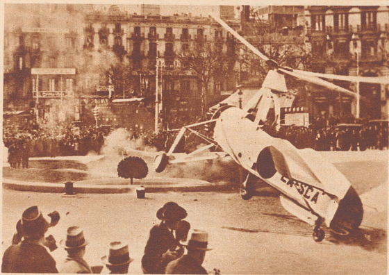
Mißglückter Start. Dieses Cierva-Windmühlensflugzeug sollte anlässlich einer Flugveranstaltung in Barcelona auf einem öffentlichen Platz zu einem Fluge aufsteigen. Der Start mißlang aber, der Autogiro vermochte sich nicht zu erheben, wurde leicht beschädigt und die paar tausend Zuschauer kamen nicht auf ihre Rechnung.