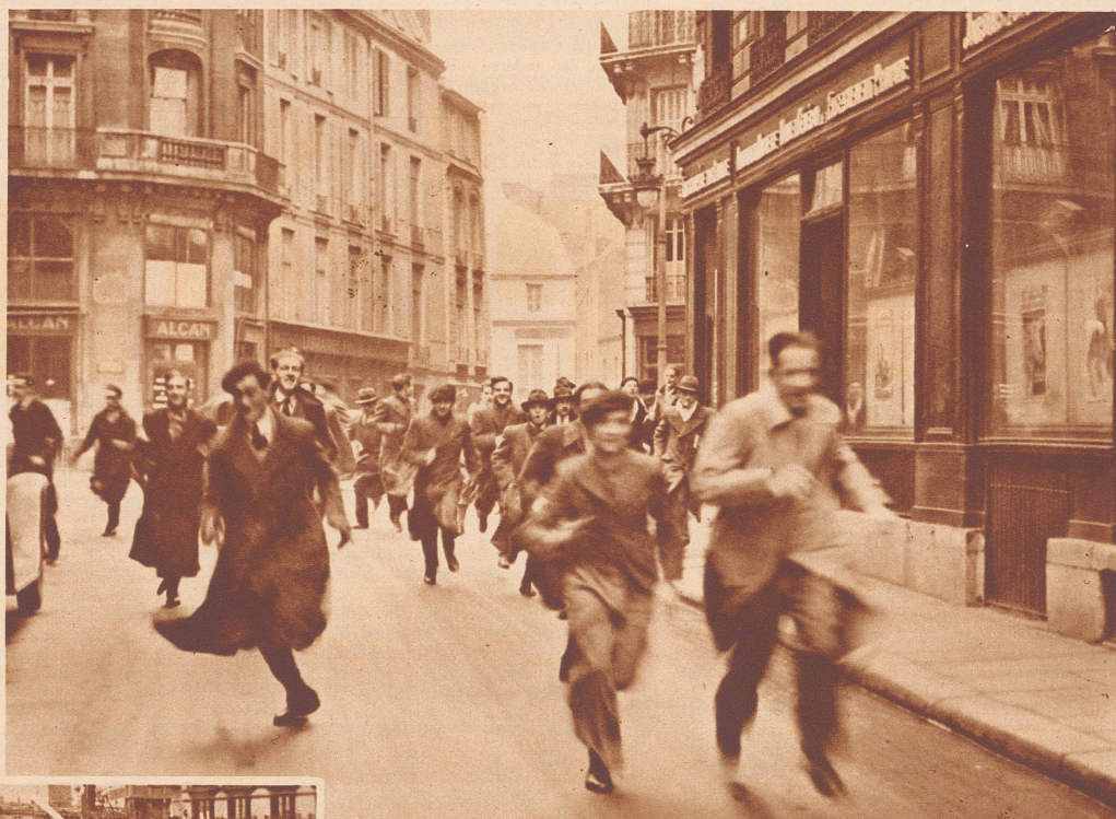
Protestkundgebungen französischer Medizinstudenten. Die französischen Medizinstudenten greifen zum Selbstschutz. Ein Gesetz aus dem Jahre 1933 gestattet auch den ausländischen Medizinern die Erwerbung des Arztdiploms. Damit verringern sich die Erwerbsmöglichkeiten für die Einheimischen, und da gerade jetzt wieder im Zusammenhang mit den Vorkommnissen in der Saar eine Einwanderungswelle sich fühlbar machte, traten an verschiedenen Orten die medizinischen Fakultäten, zunächst diejenige der Universität von Montpellier, in den Streik. In öffentlichen Kundgebungen verlangen sie behördlichen Schutz vor der drohenden Einwanderer- und Ausländerkonkurrenz. Bild: Pariser Medizinstudenten auf der Flucht vor der Polizei, die sie an Kundgebungen im Quartier Latin zu verhindern sucht.