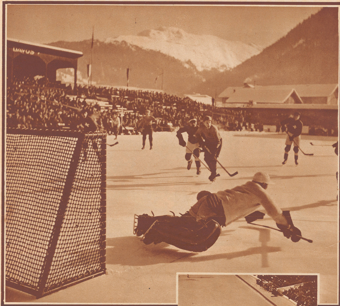
Augenblicksbild aus dem Spiel der Schweizer gegen die Schweden in der Ausscheidungsrunde. Der schwedische Torhüter wirft sich hin, um sein Tor zu decken, es gelingt ihm für einen Augenblick, 5 Sekunden später aber fliegt der Puck doch ins Gitter. Schweiz: Schweden endete mit einem schönen Sieg für unsere Nationalmannschaft, das Resultat ist 6:1.