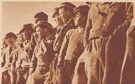
Davoser Schüler als sachverständige Zuschauer.