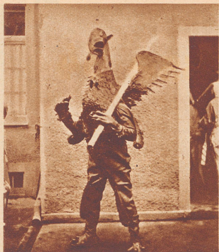
Der Vogel «Gryff», wie er durch Kleinbasels Straßen zieht . . .