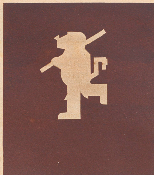
. . . und der Scherenschnitt des Wappentiers.