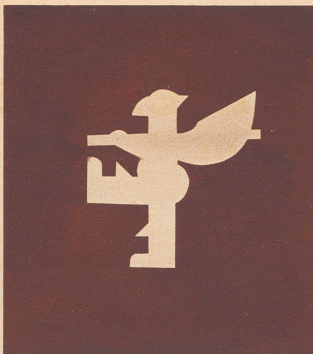
. . . und wie ihn die Schüler als Scherenschnitt wiedergaben.