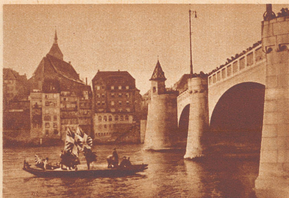
Das Schiff, auf dem der «Wilde Mann» sich befindet, fährt den Rhein hinunter. Der Wildemann führt groteske Tänze auf, kehrt aber Großbasel beständig den Rücken.