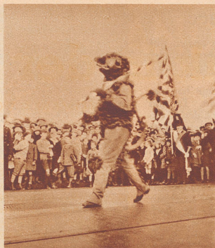
Der Wappenhalter der Gesellschaft zum «Rebhaus», der Löwe . . .