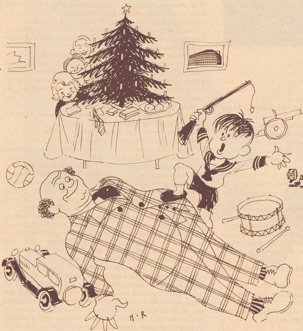
Onkel Edwards Weihnachtsfreude

Aus einem Schüleraufsatz. «Weihnachten ist ein Fest, das alljährlich gefeiert wird, und wir füllen uns glücklich dabei.