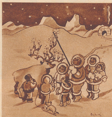
Stille Nacht bei den Eskimos.

Mutter: «Sag, Bübchen, wie gefällt dir Muttis neues seidenes Kleid?» Bübchen (begeistert): «Prachtvoll!» Mutter: «Und nun denke mal, alle diese Seide stammt von einem armen Wurm.» Bübchen: «Von Papi?»