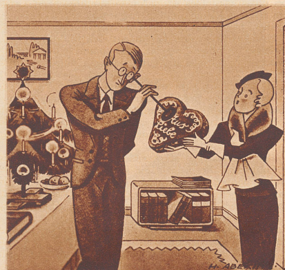
Der junge Mediziner erhält ein Lebkuchenherz geschenkt.