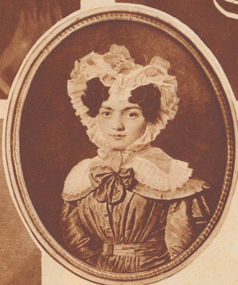
Die Mutter des Obersten, eine geborene de Courten.