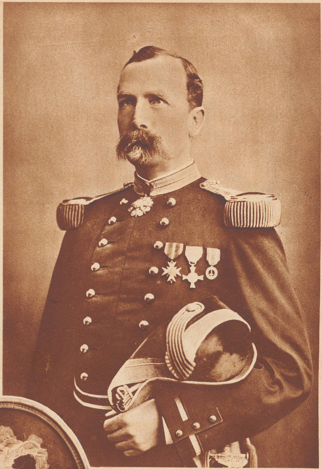
Der Kommandant der Schweizergarde, Oberst Louis de Courten, im Jahre 1888.