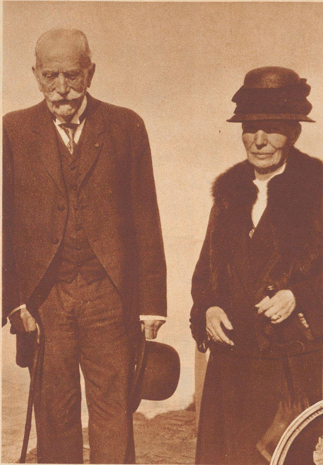
Oberst de Courten und seine Frau bei einem Besuche in Siders im Jahre 1930.