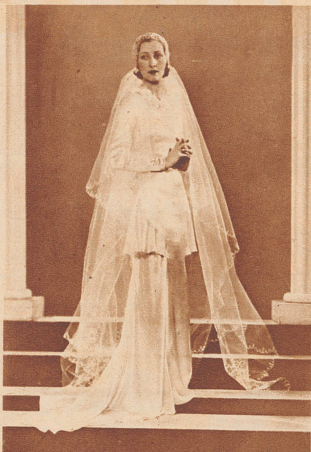
Weißer Satin in wundervoller Qualität ist das Material, aus dem das festliche Kleid gearbeitet wurde. Weiße Gardenien schmücken den Halsausschnitt. Ein aus Perlenschnüren geflochtenes Häubchen hält den Schleier.

Am 29. November findet in London die Trauung des englischen Königssohnes Prinz Georg mit der griechischen Prinzessin Marina statt.