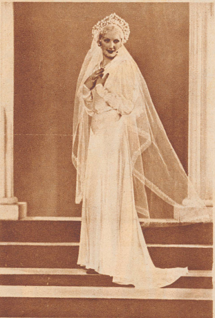
Dieses Brautkleid aus Seidensatin wird von einem geflochtenen Seidenband umgürtet. Die geschlitzten Ärmel werden mit der gleichen Seidenkordel geschmückt. Als Kopfschmuck werden Orangenblüten auf einem Silberfiliandiadem angebracht.