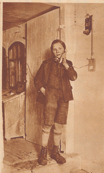
Das Telefon funktioniert. Man sieht es dem jungen Monteur an, wie er sich innerlich über die gelungene Arbeit freut.