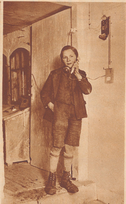
Das Telefon funktioniert. Man sieht es dem jungen Monteur an, wie er sich innerlich über die gelungene Arbeit freut.