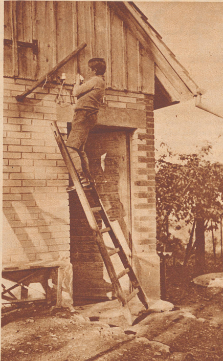
Am Hühnerstall selbst werden die Drähte nochmals um die Isolierzapfen gewickelt.