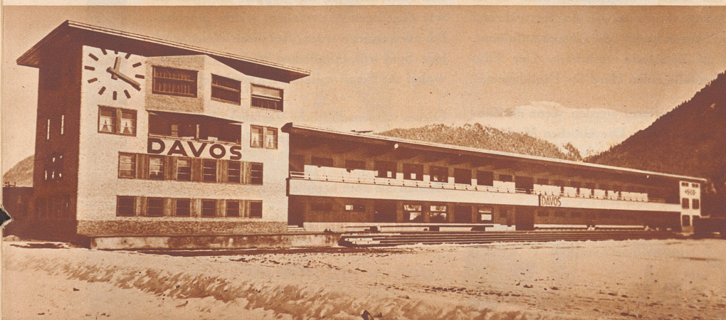
Der neue Eisbahn-Pavillon von Davos

Nachdem der Eisenbahnattentäter Sylvester Matuschka in Oesterreich seine Strafe abgesehen hat, ist er jetzt an Ungarn ausgeliefert worden. Hier hat er sich wegen der schlimmsten seiner Missetaten zu verantworten: dem Anschlag auf einen Schnellzug, den er am 12. September 1931 auf dem Viadukt von Bia Torbagy zum Entgleisen brachte. Der Absturz des Zuges hatte den Tod von 22 Reisenden zur Folge. Bild: Matuschka bei den Verhandlungen im Budapester Landesstraßengerichtshof.