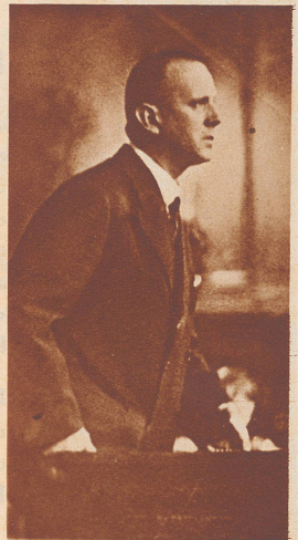
Matuschka vor den Richtern in Budapest

Nachdem der Eisenbahnattentäter Sylvester Matuschka in Oesterreich seine Strafe abgessen hat, ist er jetzt an Ungarn ausgeliefert worden. Hier hat er sich wegen der schlimmsten seiner Missetaten zu verantworten: dem Anschlag auf einen Schnellzug, den er am 12. September 1931 auf dem Viadukt von Bia Torbagy zum Entgleisen brachte. Der Absturz des Zuges hatte den Tod von 22 Reisenden zur Folge. Bild: Matuschka bei den Verhandlungen im Budapestener Landesstraßenrichtshof.