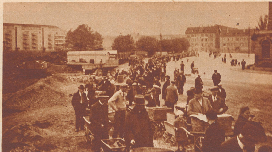
Die große Schlange der Wartenden. Mit Körben, Schachteln und Kisten und mit allen möglichen Fahrzeugen kommen die Arbeitslosen, um ihr Quantum Obst in Empfang zu nehmen.