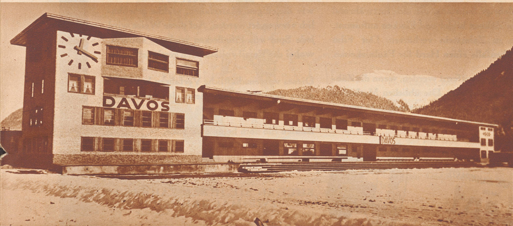
Der neue Eisbahn-Pavillon von Davos

Nachdem der Eisenbahnattentäter Sylvester Matuschka in Oesterreich seine Strafe abgessen hat, ist er jetzt an Ungarn ausgeliefert worden. Hier hat er sich wegen der schlimmsten seiner Missetaten zu verantworten: dem Anschlag auf einen Schnellzug, den er am 12. September 1931 auf dem Viadukt von Bia Torbagy zum Entgleisen brachte. Der Absturz des Zuges hatte den Tod von 22 Reisenden zur Folge. Bild: Matuschka bei den Verhandlungen im Budapestener Landesstraßenrichtshof.