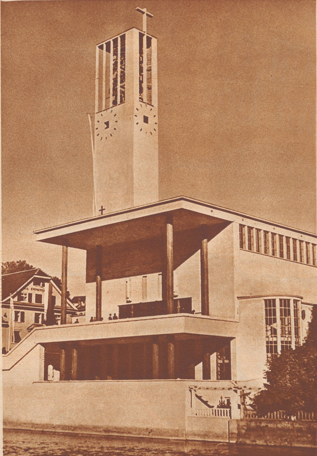
Die neue katholische Kirche zu St. Karl in Luzern. Architekt: Fritz Metzger.