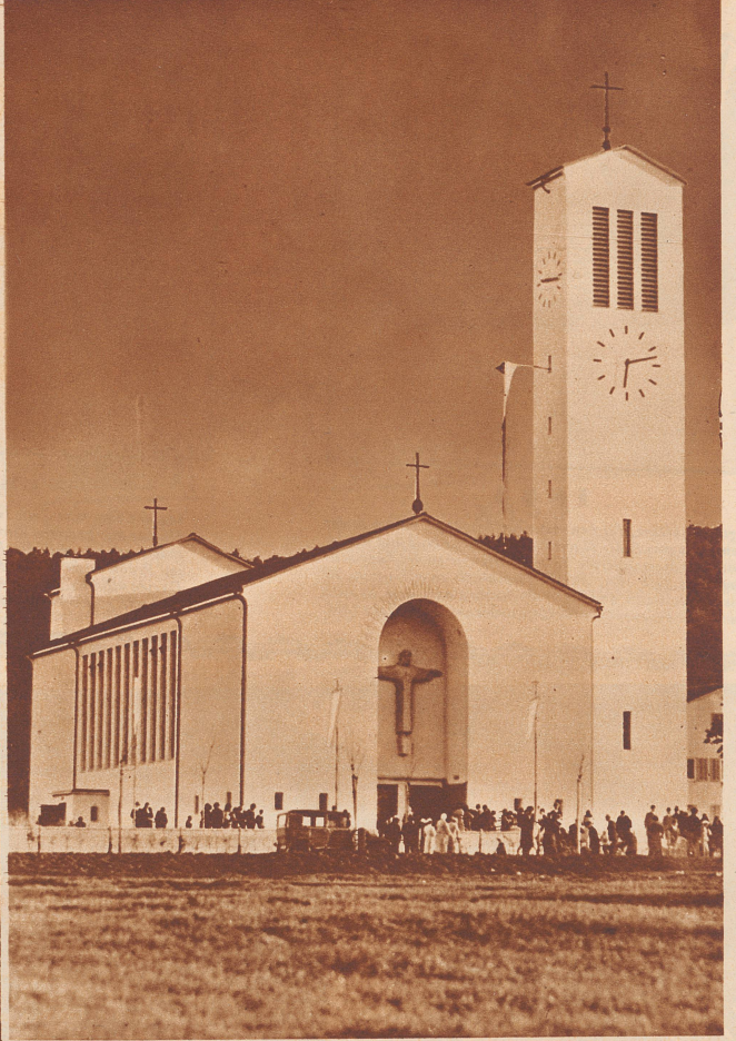
Die neue katholische Herz-Jesu-Kirche in Winterthur. Architekt: Kaczorowski. Die Plastik über dem Eingang ist eine Arbeit des Bildhauers Ed. Bick.