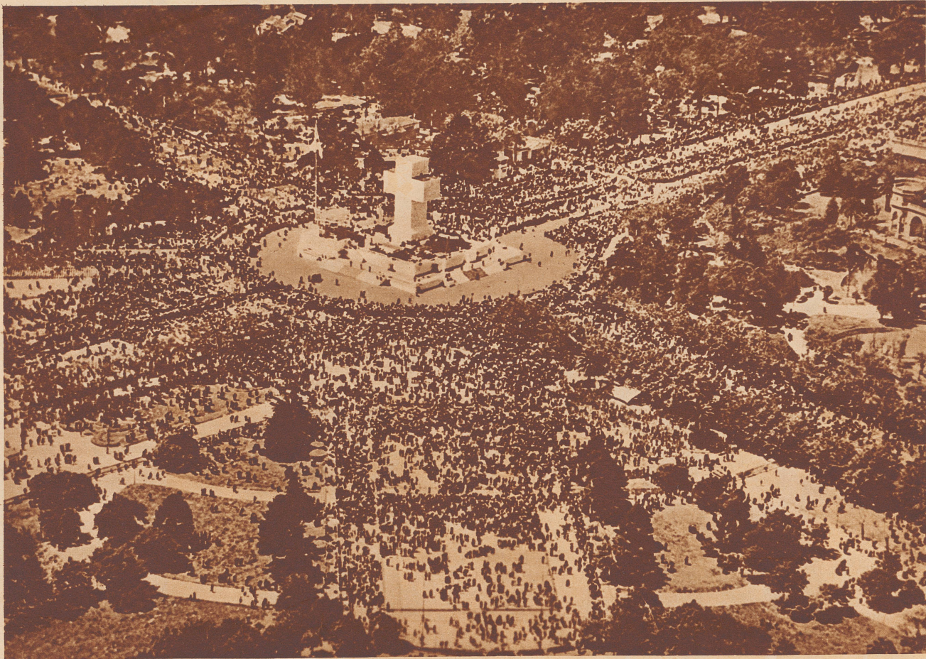
Der eucharistische Kongress in Buenos Aires. Blick in den Palermopark bei Buenos Aires, dem Versammlungsort der Besucher. Mehr als eine Million Menschen wohnten der Messe bei, die Kardinal Pacelli bei dem im Park errichteten Riesenkreuz zelebrierte.