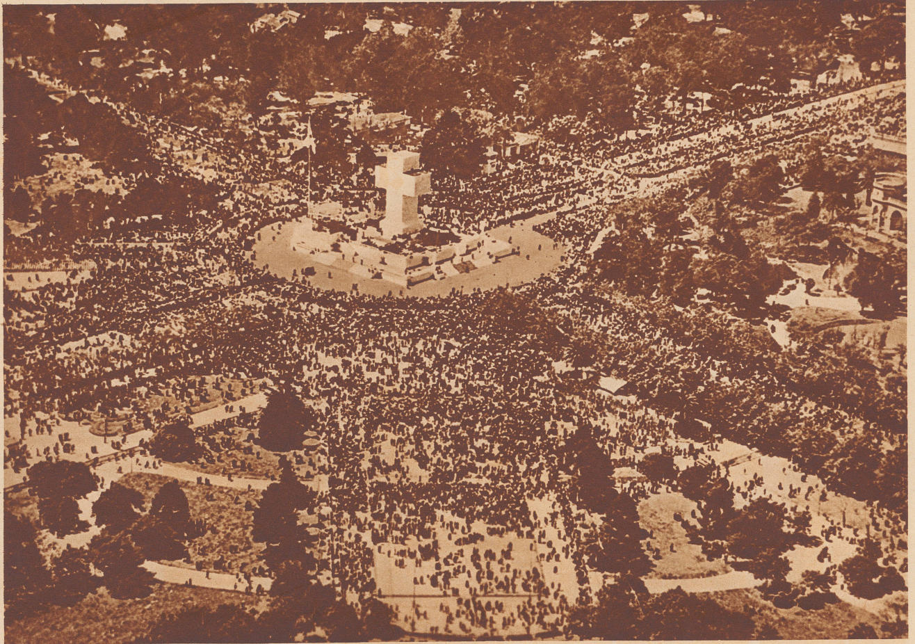
Der eucharistische Kongress in Buenos Aires. Blick in den Palermopark bei Buenos Aires, dem Versammlungsort der Besucher. Mehr als eine Million Menschen wohnten der Messe bei, die Kardinal Pacelli bei dem im Park errichteten Riesenkreuz zelebrierte.