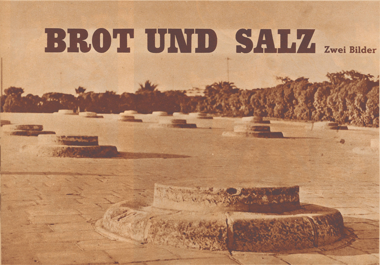
Korn-Silos innerhalb der Bastionen von Valetta aus der Kreuzritterzeit, die heute noch von der Stadtverwaltung zur Lagerung von Getreide benutzt werden.