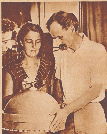
Prof. Jean Piccard, der Bruder des Stratosphärenfliegers August Piccard, bereitet in Amerika einen Stratosphärenflug vor. — Prof. Piccard und seine Frau, die ihn auf dem Flug begleiten wird.